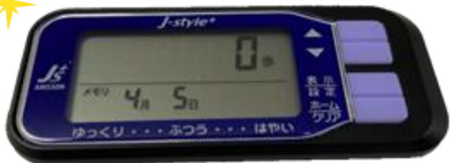
（株式会社アコース 無線活動量計 AM550N）